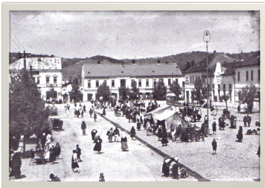
Foto: Hațeg, centrul vechi, târg de țară...