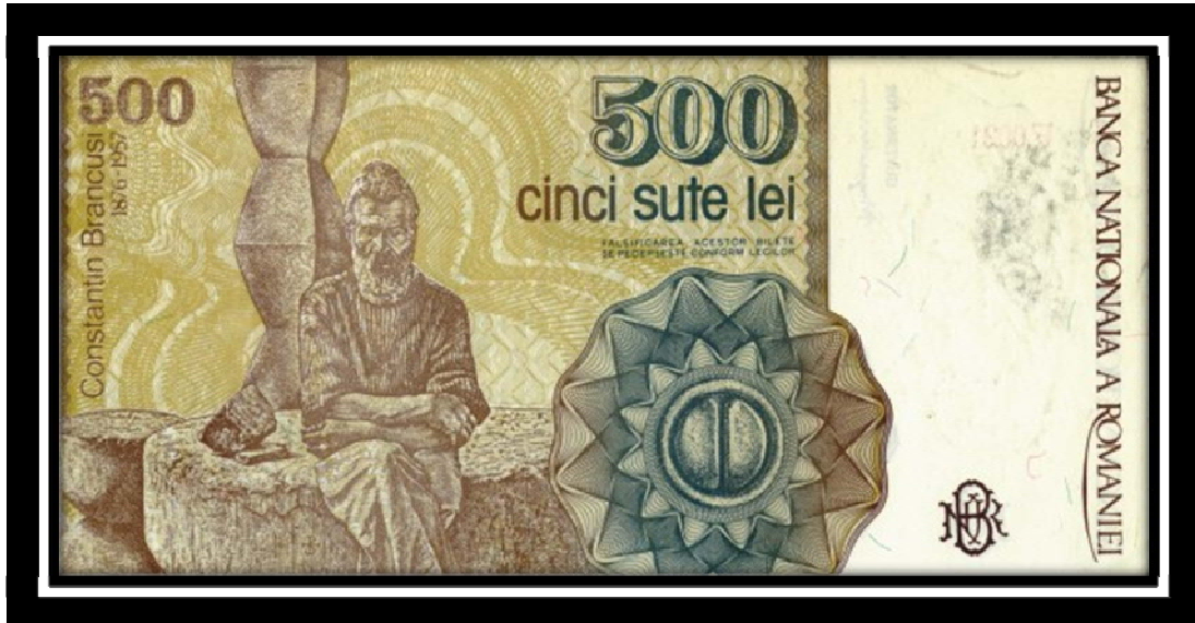
Constantin Brâncuși...