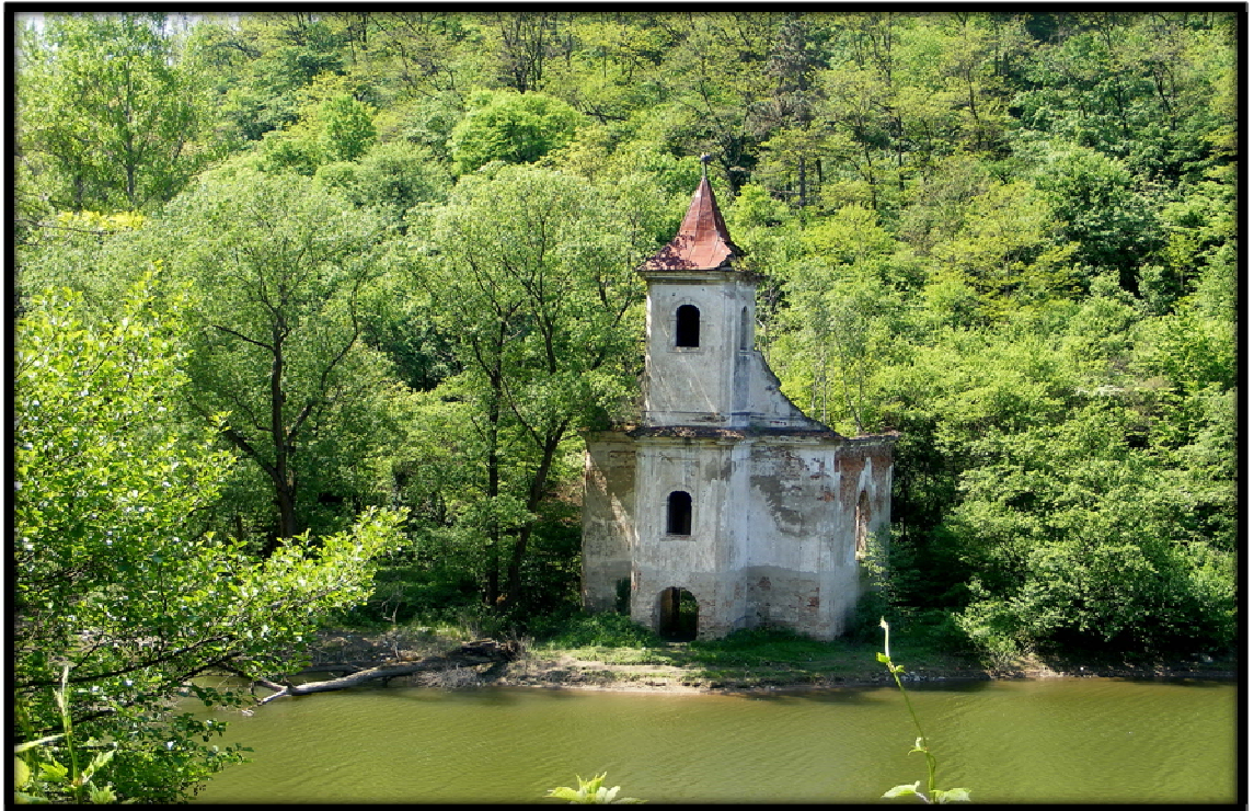
Foto: Biserica inundată de la Cinciș