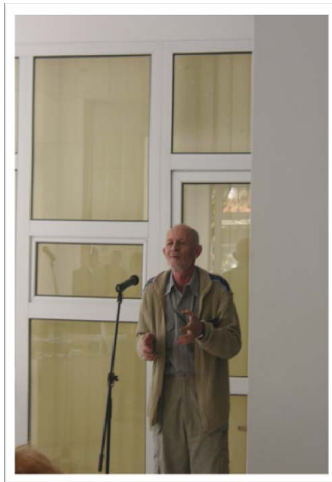
Foto: Poetul Eugen Evu, Hunedoara..., lansarea revistei Nova Provincia Corvina...