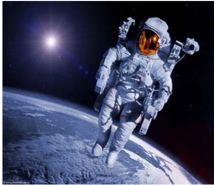
Foto: Un om în univers... omul un univers....

Scriitorul poate provoca ochiul minții să se deschidă, este o chemare la schimbare - o schimbare a minții care declanșează schimbarea vieții, ieșirea la loc larg.