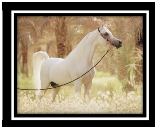
FOTO: UN CAL ARAB.....